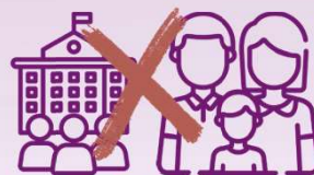
行使公權力之 人員及其親屬