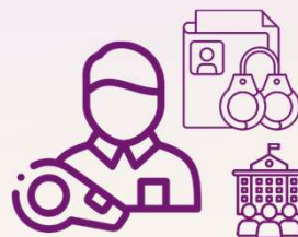
共犯/正犯 揭弊者之公務員